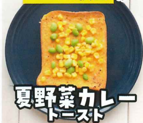
夏野菜カレー トースト