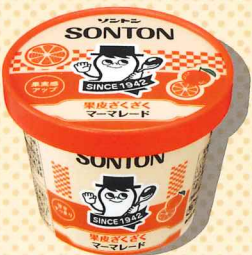
果皮ざくざくマーマレード