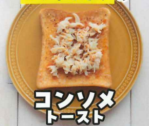
コンソメ トースト