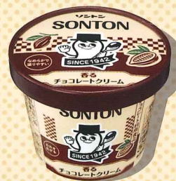
香るチョコレートクリーム