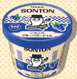
ごろごろブルーベリージャム