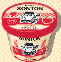
つぶつぶイチゴジャム

現行品からフレーバー素材の量をアップさせ、風味がより豊かに感じられるように仕上げました。 糖類の配合にもこだわり、キレのある甘さで後味もすっきり。冷蔵庫に入れても塗りやすいクリームで、お客様の利便性もアップしています。