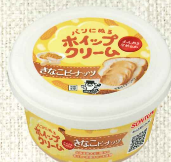
きなこピーナッツ

深煎りピーナッツを使用した香ばしいピーナッツクリームで、甘さひかえめに仕上げました。粒ピーナッツ入りでカリッとした食感が楽しめます。