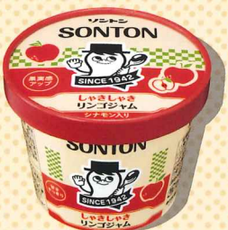
しゃきしゃきリンゴジャム