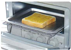
STEP2 トースターで焼く