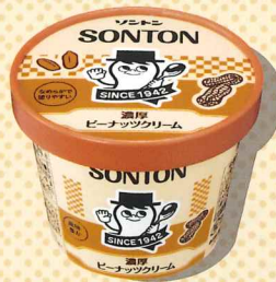
濃厚ピナツククリーム