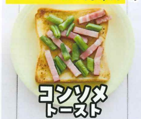
コンソメ トースト