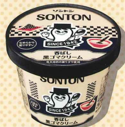
香ばし黒ゴマクリーム