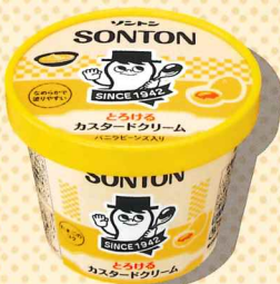
とろけるカスタードクリーム